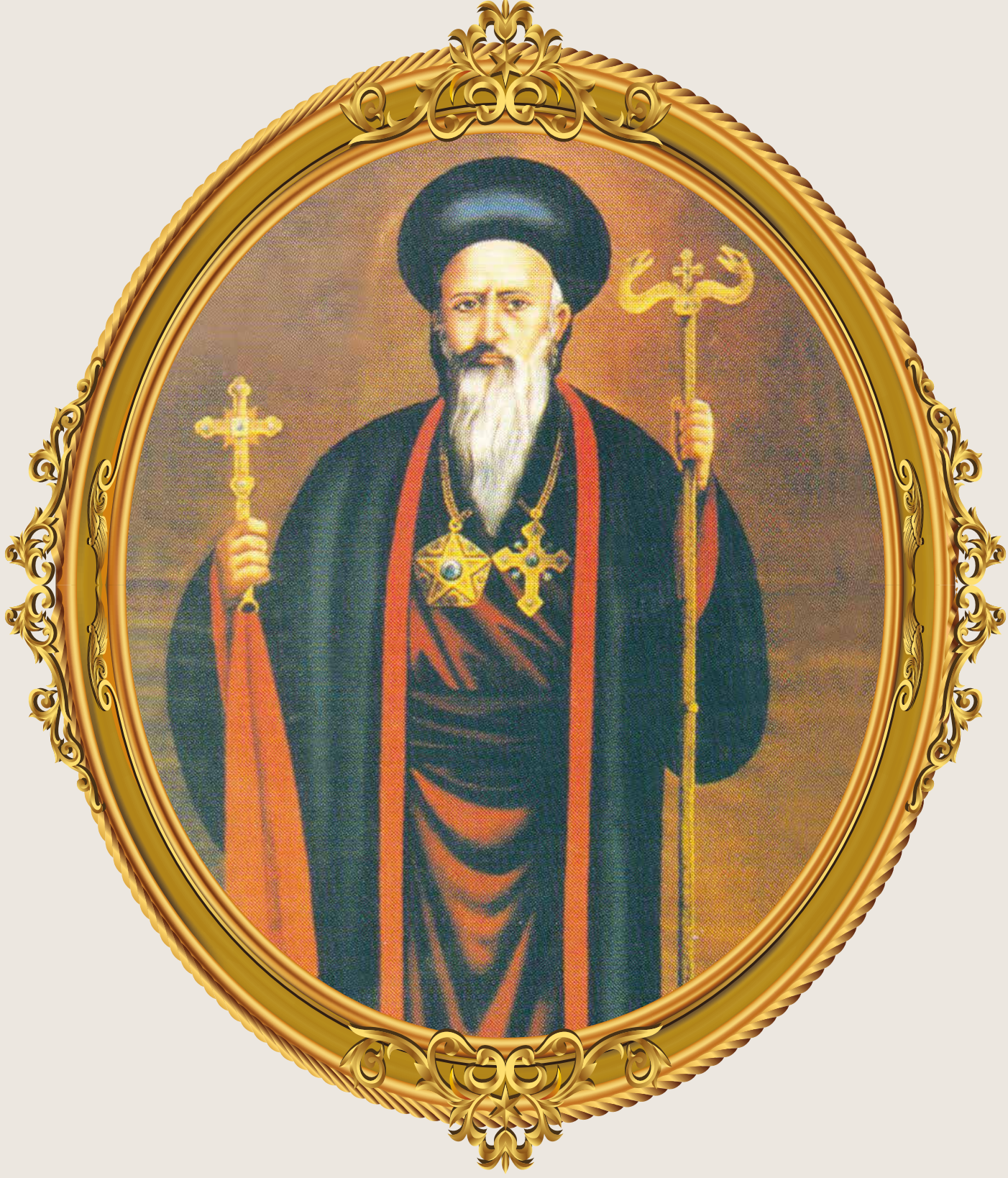
ܐܘܪܘܫܠܝܡ ܕܥܘܣܩܘܢܝܳܗܳܝܳܢ ܕܥܘܣܩܘܢܝܳܗܳܝܳܢ ܕܥܘܣܩܘܢܝܳܗܳܝܳܢ ܕܥܘܣܩܘܢܝܳܗܳܝܳܢ (ܐܘܣܩܘܢܝܳܗܳܝܳܢ - ܐܘܣܩܘܢܝܳܗܳܝܳܢ) Rahmetli Patrik Moran Mor İğnadius Yakup II. (İstanbul Patriklik Vekilliği 1844 - 1847)